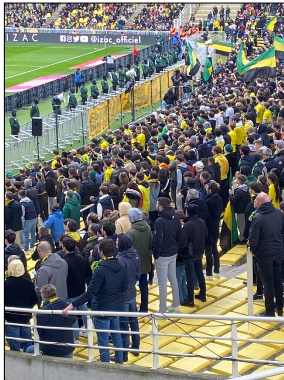
Inzet van zogenaamde “schaarhekken” tussen tribune en veld (AS Nancy, Frankrijk)