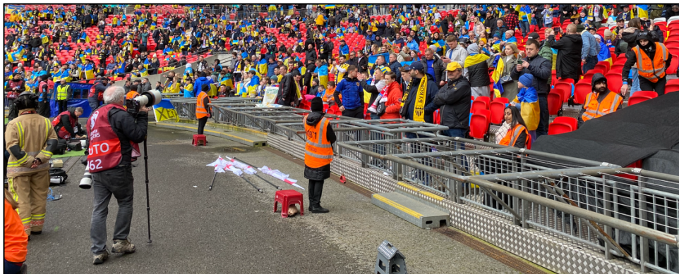
Maatregelen tegen veld betreden in Wembley Stadium