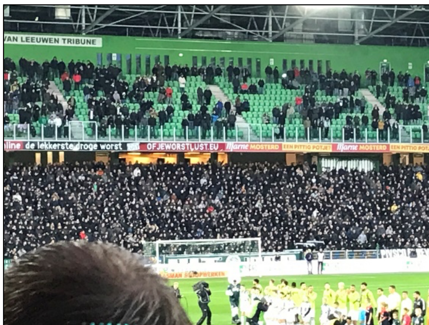
Een relatief lege 2 e ring en een overcrowded situatie op de 1 e ring met volle trappen Geen steward inzet zichtbaar.

Ook hoort daar, na realisatie, aanpassing van de steward- en beveiligingsinzet bij.